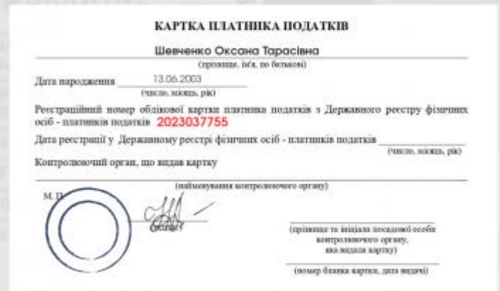
картка платника податків